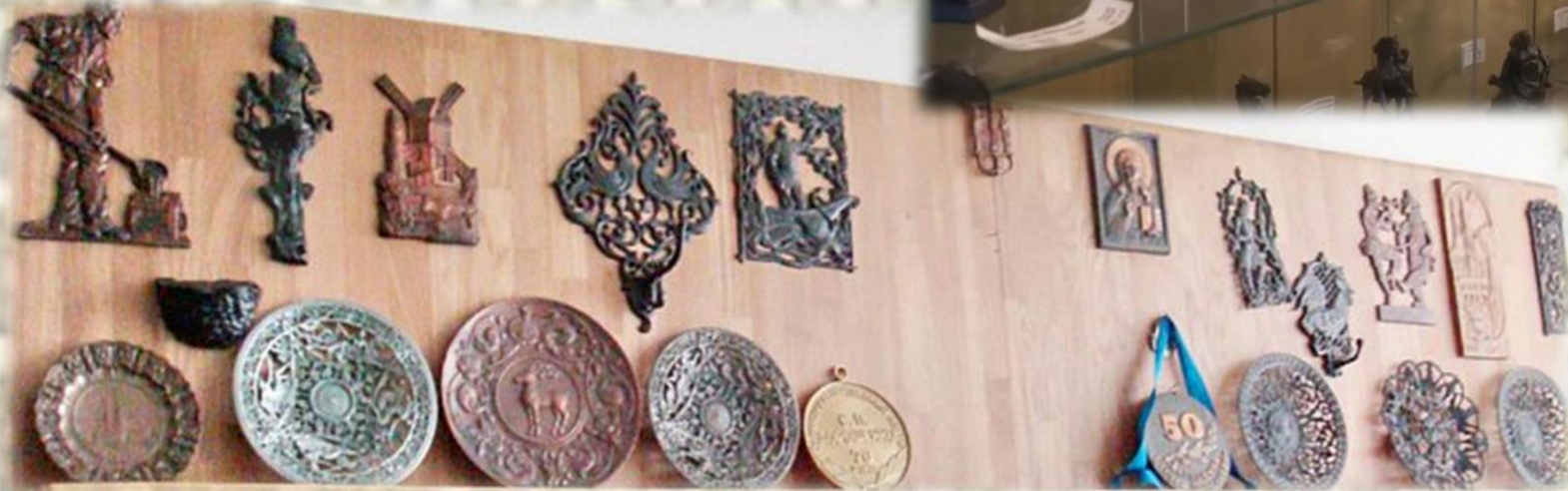
Експонати музею із різних видів металів.