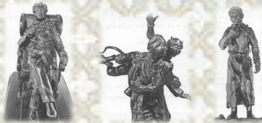
Персонажі М. Гоголя з колекції Кірієвського Б. А.

«Ми працю славимо, що в творчість перейшла, У музику палку, що серце тисне. У щастя людського два рівних є крила - Троянди й виноград, красиве і корисне».