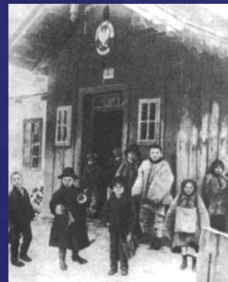
Учні біля школи, де навчався Стефаник.