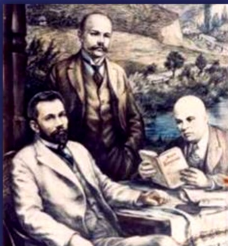
▲ Василь Касіян. «Покутська трійця» – Василь Стефаник, Лесь Мартович, Марко Черемшина (1949)

У 1897 році вперше відбулися публікації його новел у Львівському журналі «Літературно-науковий вісник», а вже у червні 1899 року у Чернівцях вийшла з друку «Синя книжечка» - перша збірка новел Стефаника.