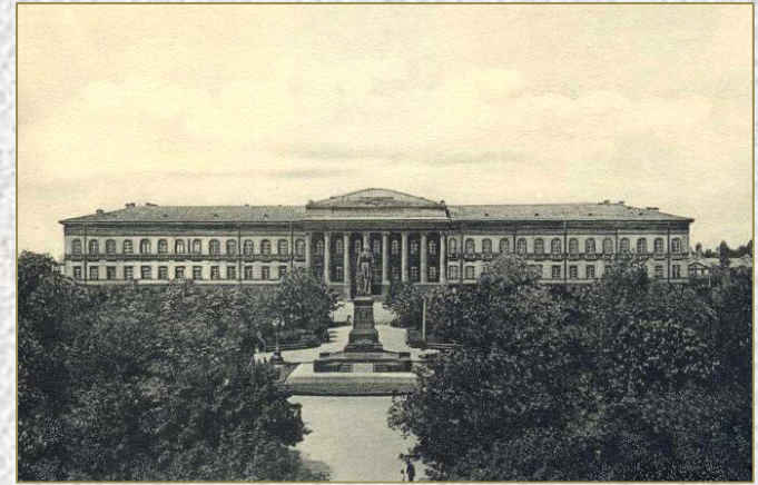
6 жовтня 1918 р. у Києві гетьман Павло Скоропадський відкрив перший український державний університет

Кульмінацією розвитку тогочасного наукового життя стало відкриття у листопаді 1918 року Української Академії наук. Науковцям надали право захищати дисертації українською мовою.