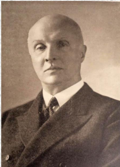
Павло Скоропадський на еміграції

16 квітня 1945 року, під час бомбардування станції Платлінг поблизу Мюнхена Павло Скоропадський був смертельно поранений і 26 квітня 1945 року помер у лікарні монастиря Меттен. Похований у м. Оберсдорф у родинному склепі Скоропадських.