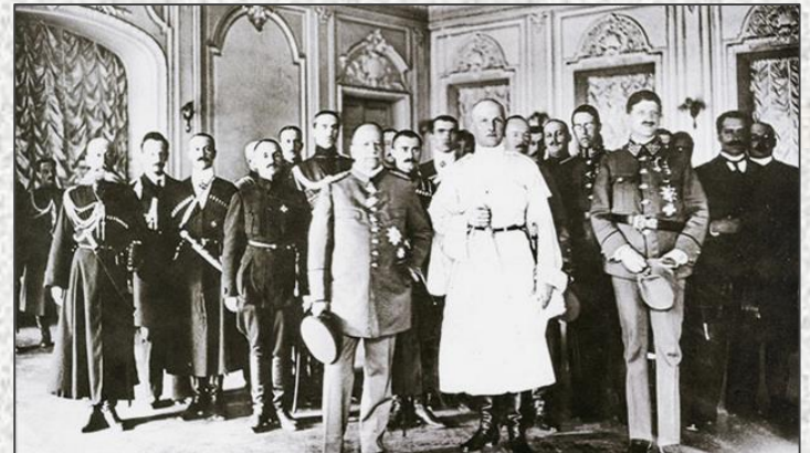
Прийом у Гетьмана Павла Скоропадського, Київ, 1918 рік