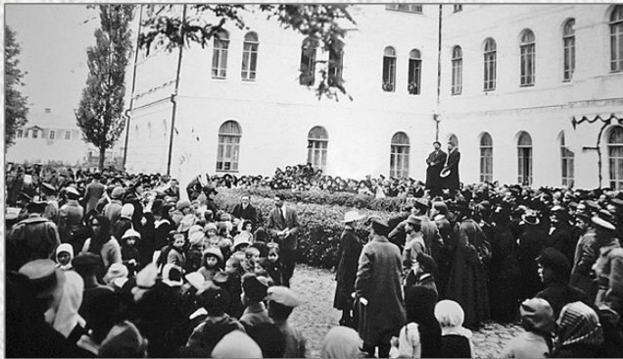
22 жовтня святково відкрили Кам'янець-Подільський державний український університет. Його ректором було обрано Івана Огієнка.

2 серпня 1918 року засновано Національну бібліотеку Української Держави (нині – Національна бібліотека України імені Володимира Вернадського). Розпочалося академічне видання творів Тараса Шевченка й Івана Франка.