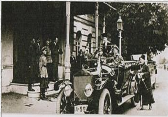
Гетьман Скоропадський перед своєю резиденцією на Інститутській вулиці 40, де він проводив зустрічі з іноземними послами

Гетьманська держава здобула широке міжнародне визнання, встановивши дипломатичні зв'язки з Австро-Угорщиною, Болгарією, Туреччиною, Данією, Персією, Грецією, Норвегією, Швецією, Італією, Швейцарією, Ватиканом, а загалом де-факто із 30 -тьма державами світу.