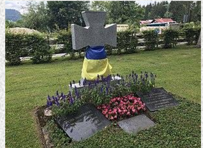
Могила П. Скоропадського в м. Оберсдорф на півдні Баварії.

Основний висновок для сучасності з його життя та діяльності – поважати і пам'ятати всіх діячів, які наближали відродження незалежної України, стали її справжніми "батьками – засновниками«.