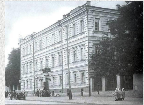
Пансіон графині Катерини Левашової - перше приміщення Української Академії наук, 1918 р.