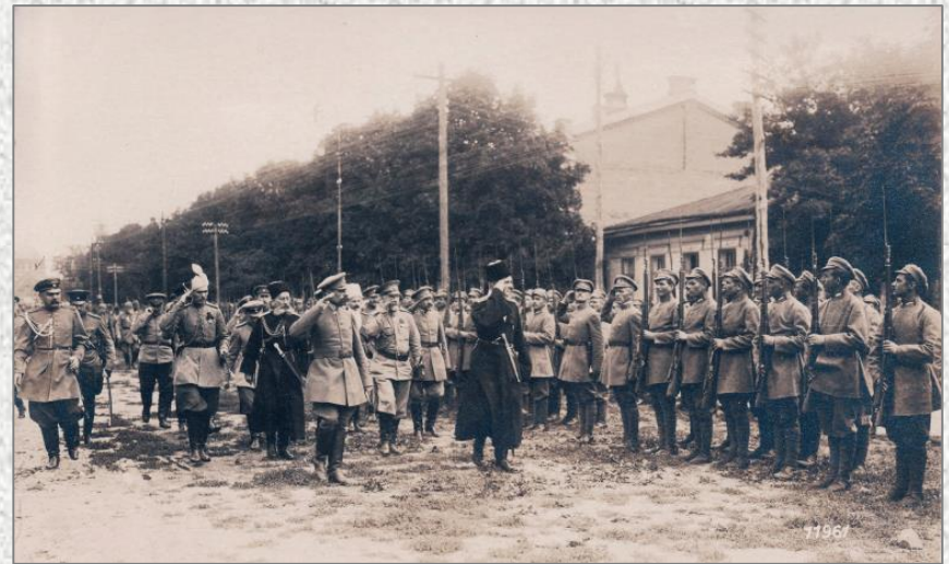
Гетьман Скоропадський зі штабом оглядає Сірожупанну дивізію, серпень 1918 року