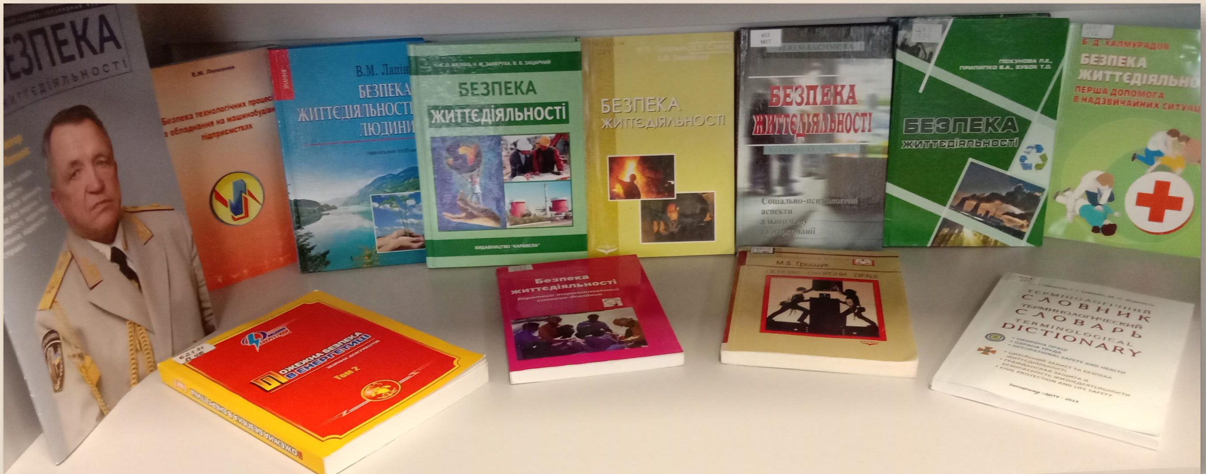
Цивільний захист і охорона праці в галузі: навчальний посібник / С. О. Ковчога, С. А. Тузіков, Є. В. Карманний, А. П. Зенін. – Харків, 2018. – Розд. 2. - С. 125-129.

Промислова, технічна та наступна науково-технічна революції так оснастили людину технікою і підвищили її могутність, що вплив "homo sapiens" на середовище власного проживання порушив природні процеси, які відбувались на Землі віками. Техногенний тиск на систему "людина - життєве середовище" став настільки відчутним, що питання "бути, чи не бути?" потребує прямої і, мабуть, негайної відповіді.