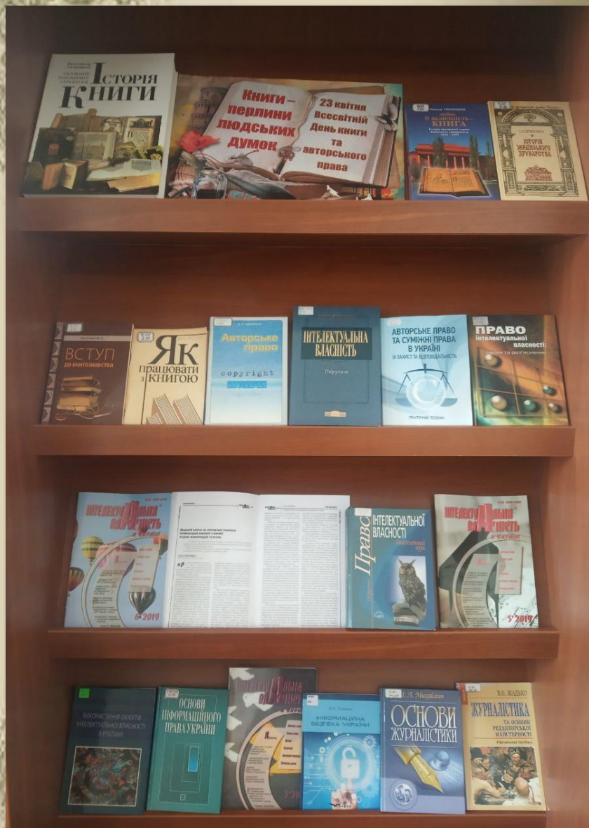
Виставка у читальному залі економіко – гуманітарної літератури (ауд.513)

Книги - морська глибина, Хто в них пірне аж до дна, Той, хоч і труду мав досить, Дивнії перли виносить. (І. Франко)